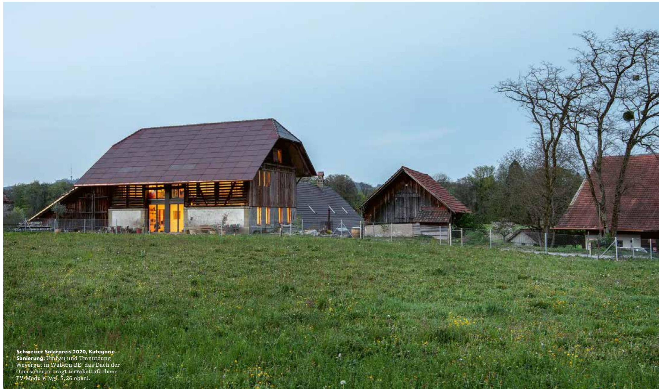
Schweizer Solarpreis 2020, Kategorie Sanierung: Umbau und Umnützung Weyergut in Wabern BE; das Dach der Querscheune trägt terrakottafarbene PV-Module (vgl. S. 26 oben).

Foto: Halle 58 Architekten, Porträt: zVg